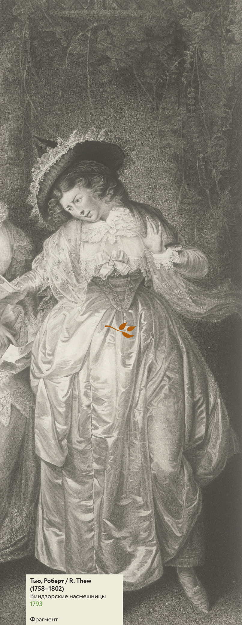
Тью, Роберт / R. Thew (1758–1802) Виндзорские насмешницы 1793