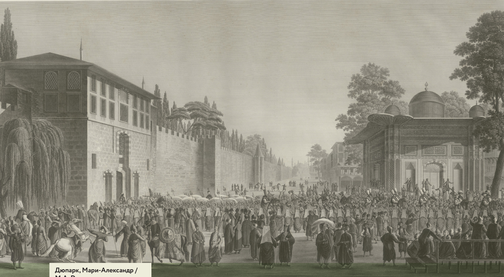
Дюпарк, Мари-Александр / M.A. Duparc (1760–после 1825) Торжественный проход султана из дворца Топкапы в мечеть во время байрама 1802–1819