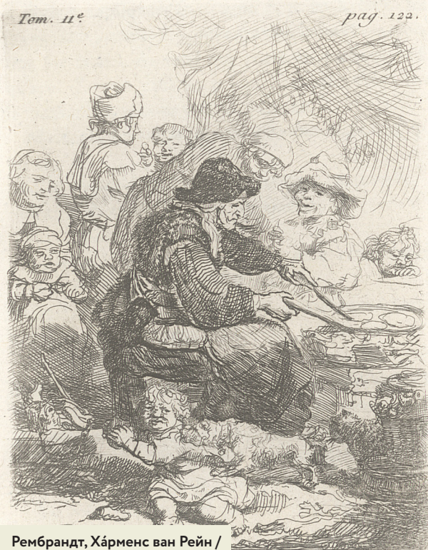
Рембрандт, Хэрменс ван Рейн / Rembrandt (1606–1669) Блинщица 1635