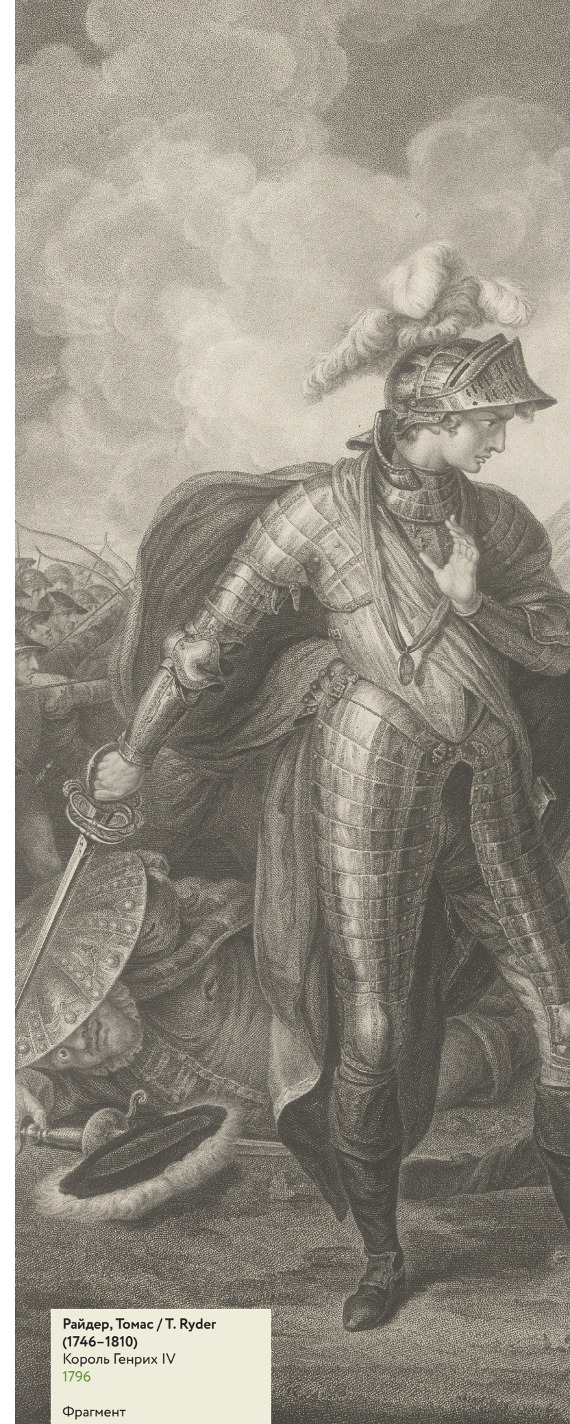
Райдер, Томас / T. Ryder (1746–1810) Король Генрих IV 1796