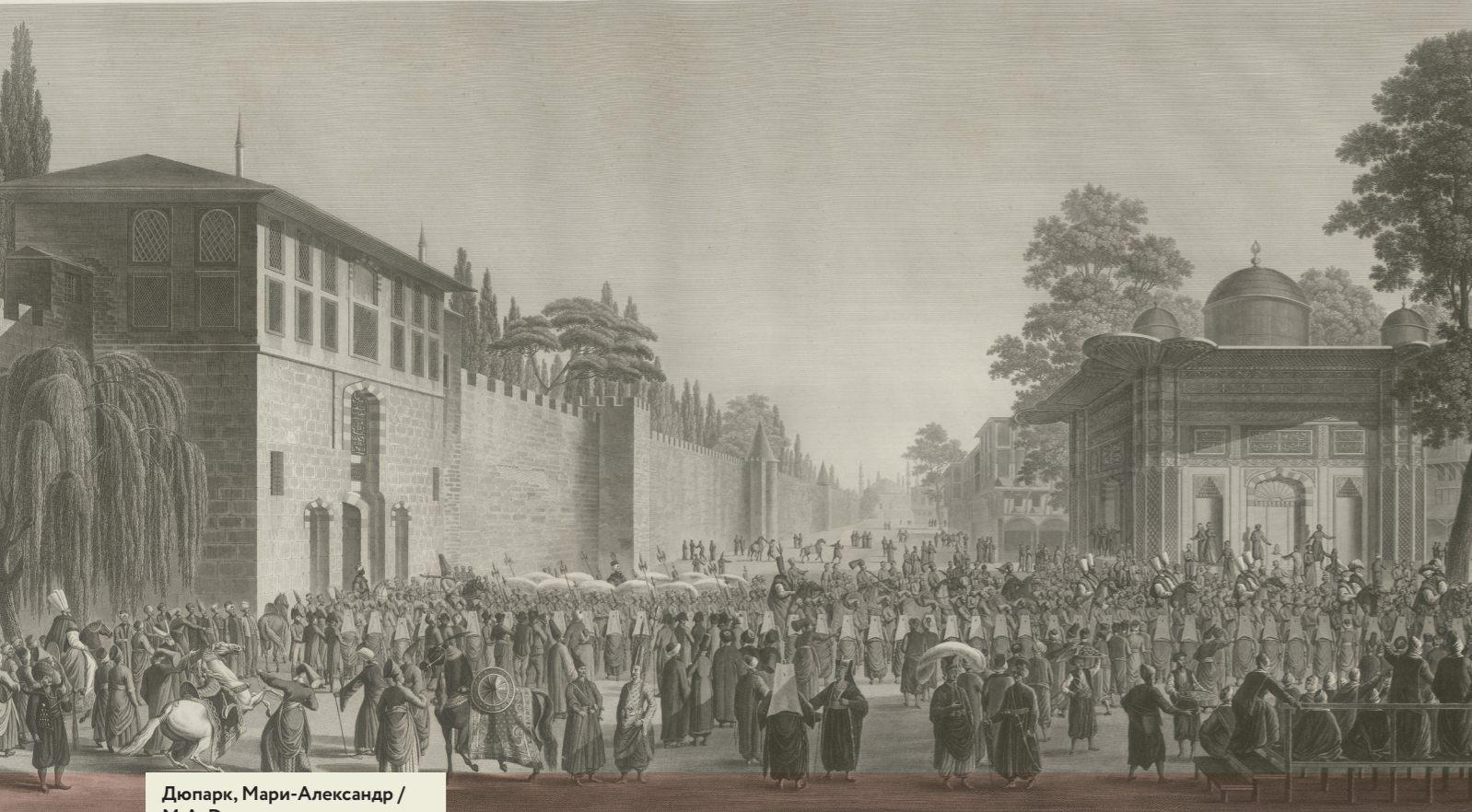
Дюпарк, Мари-Александр / M.A. Duparc (1760–после 1825) Торжественный проход султана из дворца Топкапы в мечеть во время байрама 1802–1819