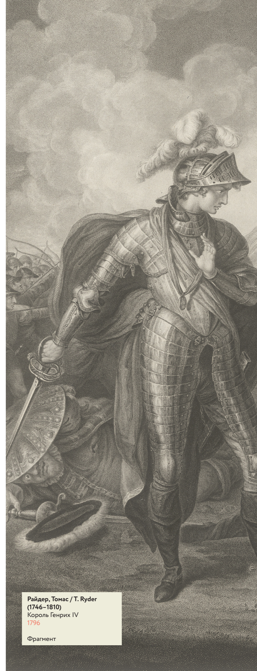
Райдер, Томас / T. Ryder (1746–1810) Король Генрих IV 1796