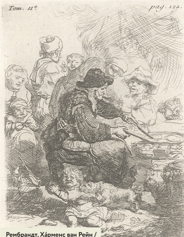
Рембрандт, Хартменс ван Рейн / Rembrandt (1606–1669) Блинщица 1635