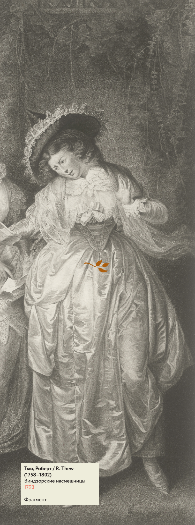
Тью, Роберт / R. Thew (1758–1802) Виндзорские насмешницы 1793